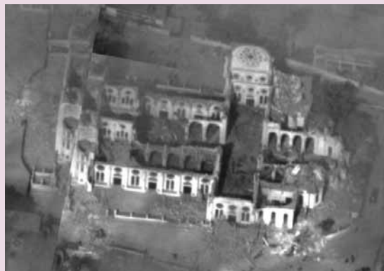
De verwoeste kathedraal van Port-au-Prince